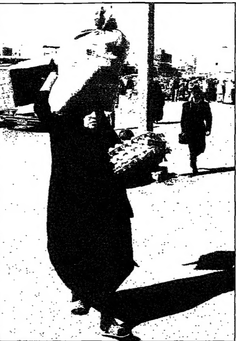
سيدة تحمل أغذية وصلتها من سوق بغداد حيث وصلت أول شحنة من المواد الغذائية